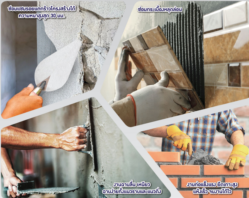
ซ่อมแซมรอยแตกร้าวโครงสร้างได้ ความหนาสูงสุด 30 มม.