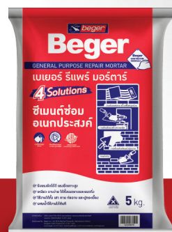
ขนาด 5 KG.