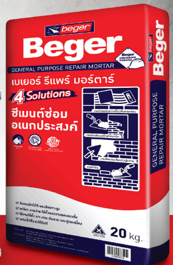
ขนาด 20 KG.