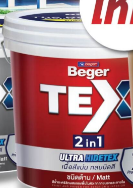
ภายนอก-ภายใน/ด้าน