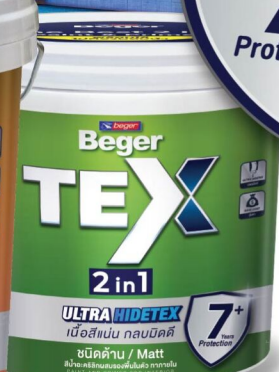
ภายใน/ด้าน