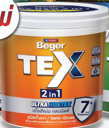
ภายนอก-ภายใน/ทึ่งเงา