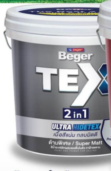
ทาฝ้า-ภายใน/ด้านพิเศษ