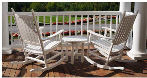
สีขาวเบอร์ BD-222