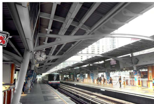
สถานีรถไฟฟ้านีทีเอส