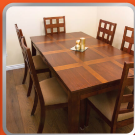
เฟอร์นิเจอร์ไม้ Furniture

กระทิง ยูรีเทน เค-5000 เป็นน้ำมันเคลือบแข็งชนิดโพลียูรีเทน ระบบ 1 ส่วนผสม สำหรับภายนอก - ภายใน ที่อาศัยความชื้นทำให้แข็งตัว มีสีใสแวววาว ทนต่อการขีดข่วน การหักโคง การกระแทก ทนความร้อน และสารเคมีต่างๆ เหมาะสำหรับใช้ทาพื้นไม้ที่ต้องการโชว์ลายไม้ ชัดเจน อาทิเช่น พื้นไม้ปาร์เก้ ลานสเก็ต รางโบริลล์ พลอร์ลีลาศ พื้นบันได รวมถึงงานเฟอร์นิเจอร์ไม้ต่างๆ และงานเคลือบพื้นคอนกรีต เป็นต้น