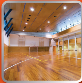
ลานสเก็ต Indoor Sport arena