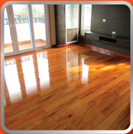
พื้นไม้ปาร์เก้ Parquet Floor