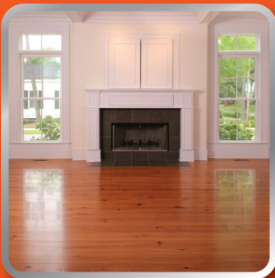
พื้นไม้จรัส Wooden Floor