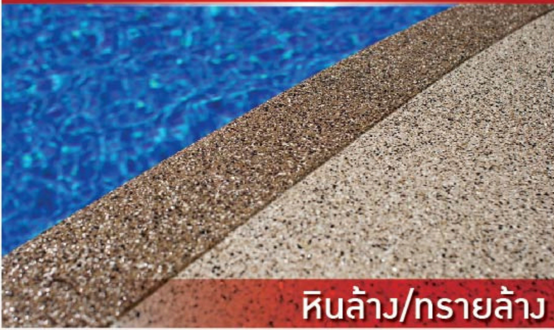
หินล้าง/ทรายล้าง