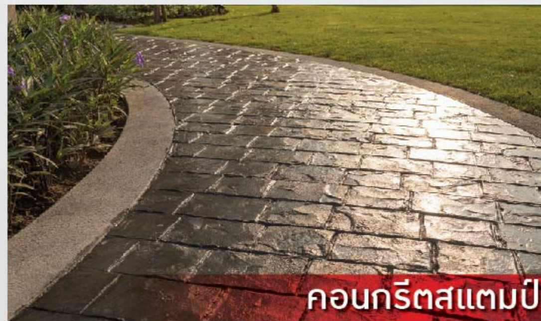
คอนกรีตสแตมป์