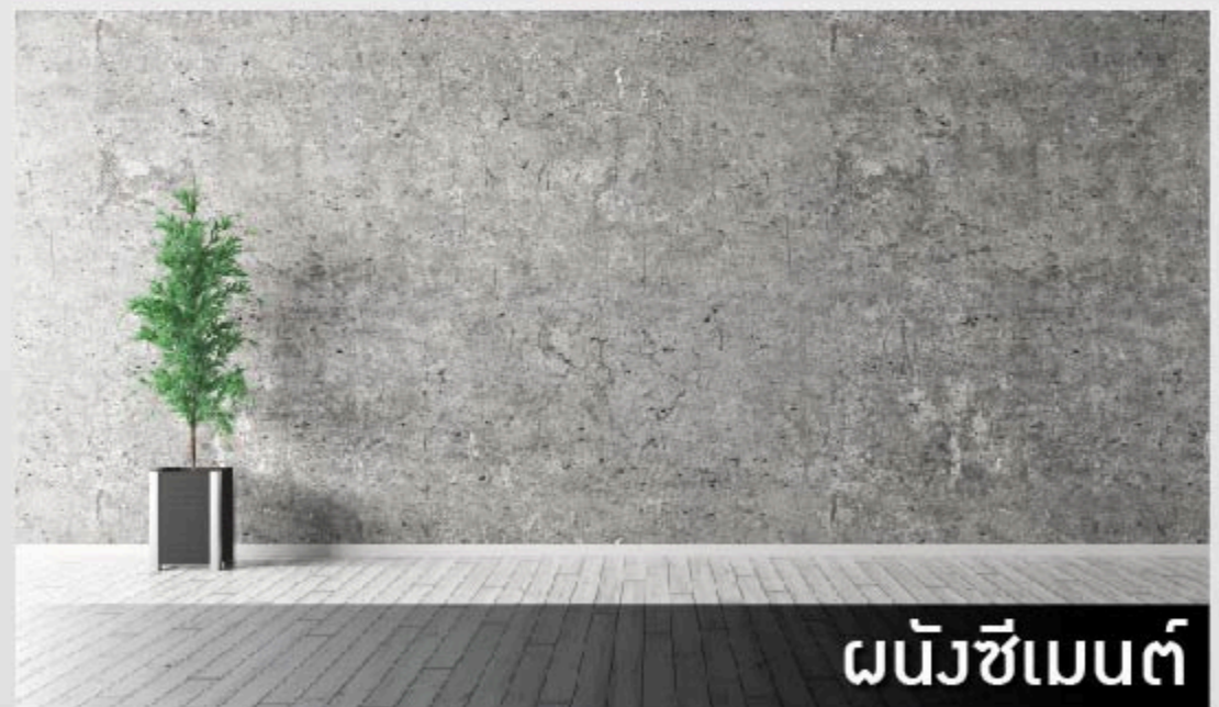
ผนังซีเมนต์

*ห้ามใช้กับกระเบื้องเซรามิก และแกรนิตโต้