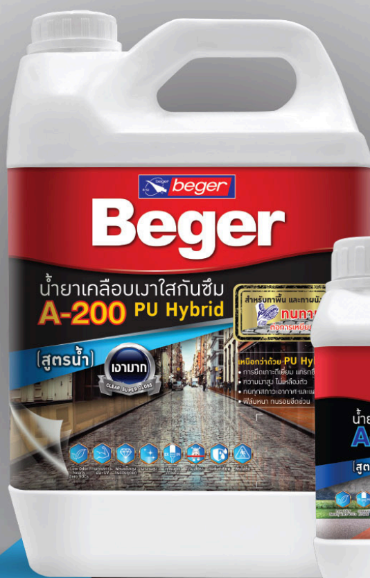
ขนาด 3.5 ลิตร