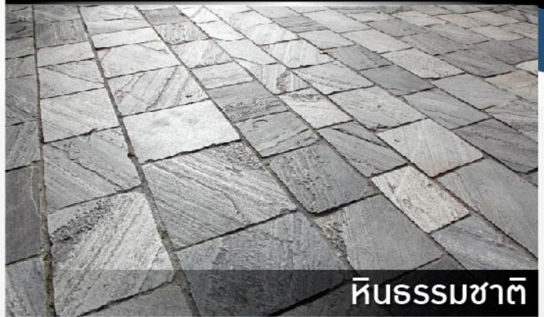
หินธรรมชาติ