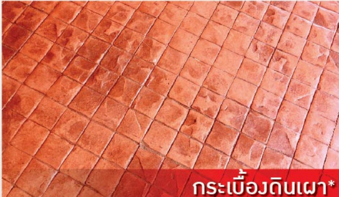
กระเบื้องดินเผา*