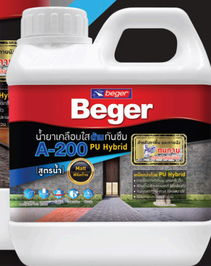
ขนาด 0.875 ลิตร