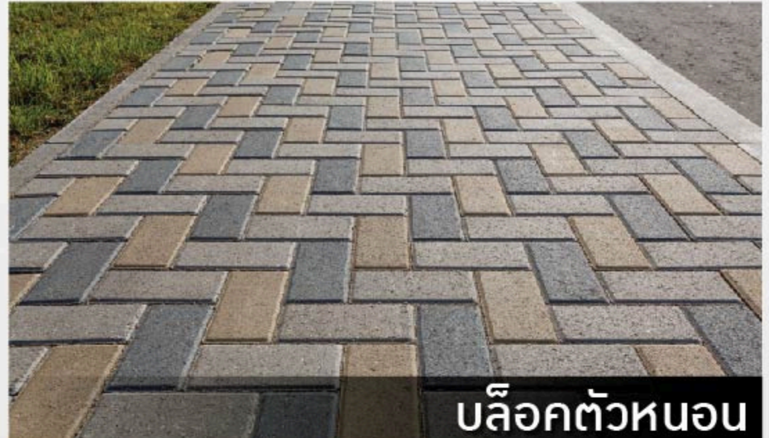
บล็อกตัวหนอน