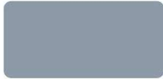
Winter Grey S-6702