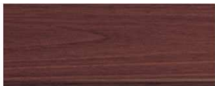
M-7105 สีไม้แดง Redwood