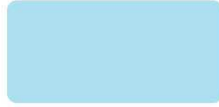
Rainy Lake S-6501