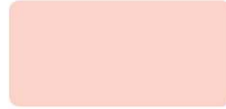
Coral Peach S-6201