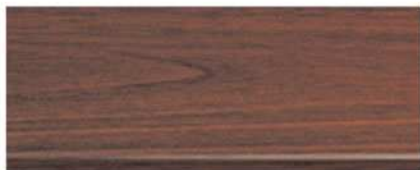
M-7111 สีไม้โอ๊ค Oak