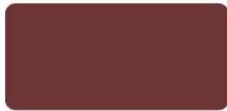
Great Sun S-6804