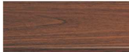
M-7104 สีไม้ประดู่ Afromosia