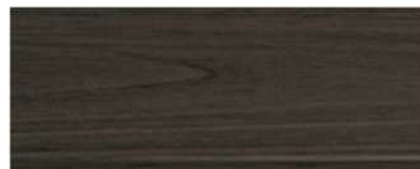
M-7108 สีไม้มะเกลือ Ebony