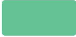
Spring Green S-6602