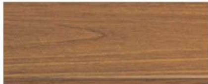
M-7102 สีไม้สัก Teak