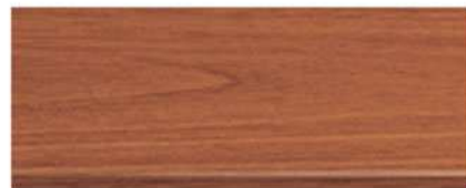
M-7109 สีไม้มะฮอกกานี Mahogany