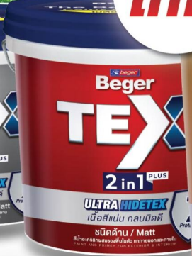
ด้าน/ภายนอก