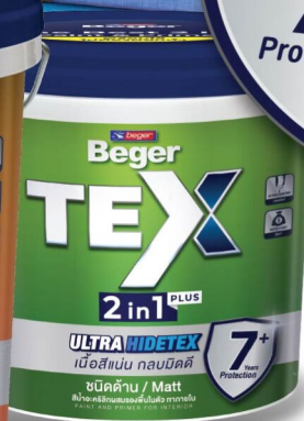
ด้าน/ภายใน