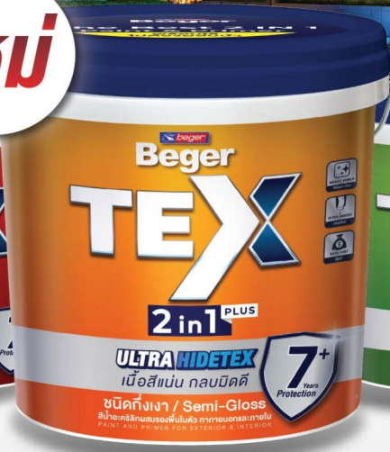
ทึงเงา/ภายนอก